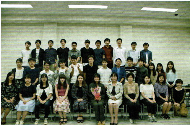
慶應義塾大学日吉キャンパスの皆さんと講演後に。