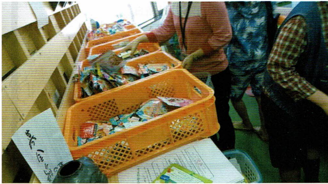
無料スーパーの様子。主催はいつも緊張します...