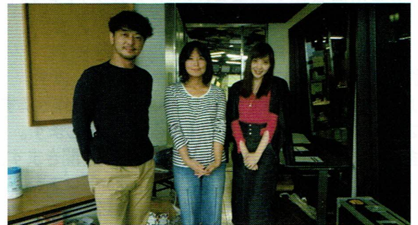
TOKYO FMで。はじめてのスタジオ生放送...腹痛。