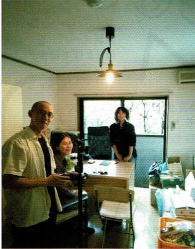
7月からの食品倉庫で、取材を受けるところ。