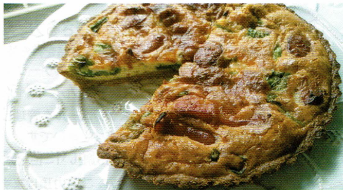
11/4、府中プラッツでの講演&乾パンでキッシュ作ります。